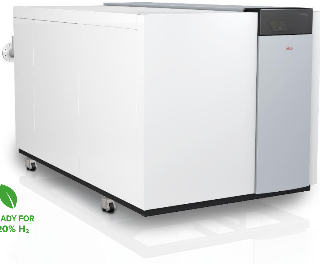
TRIGON® XXL Kondenzációs gázkazán