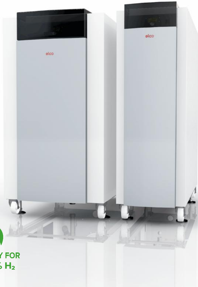
TRIGON® XL Kondenzációs gázkazán